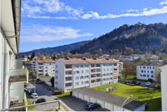
Blick an den Gebhardsberg