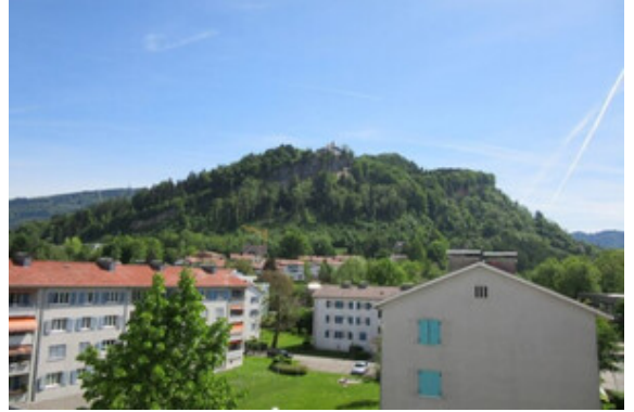
Panoramablick vom Balkon 2