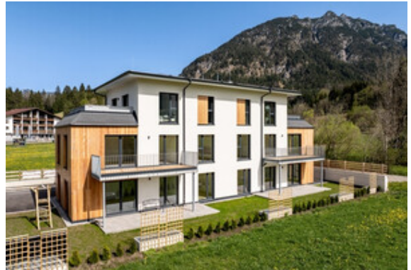
Außenansicht Haus B