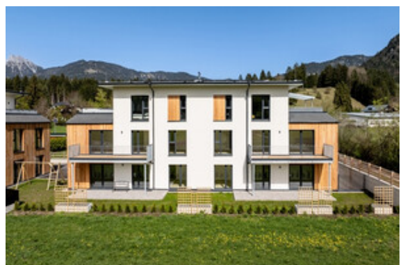
Außenansicht Haus B