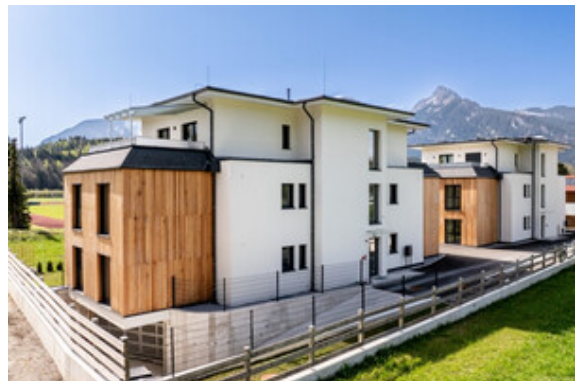
Außenansicht / Tiefgarageneinfahrt