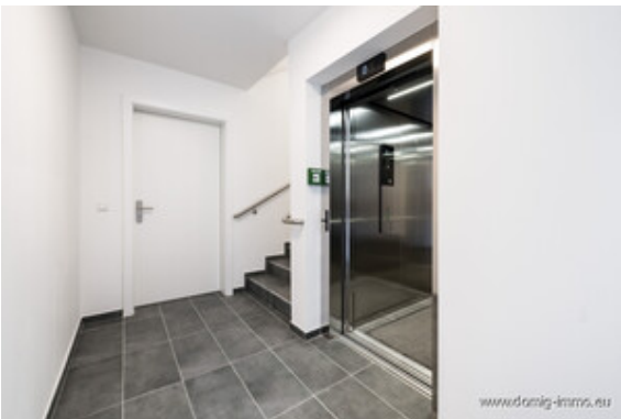
Aufzug / Stiegenhaus