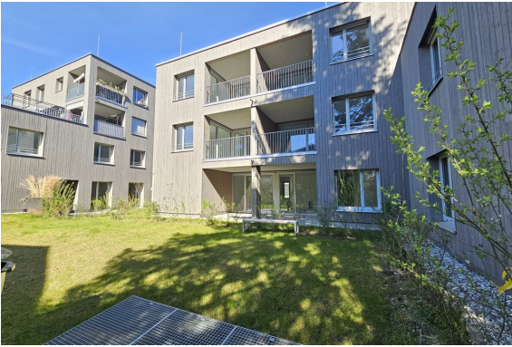
Außenansicht | Gemeinschaftsgarten