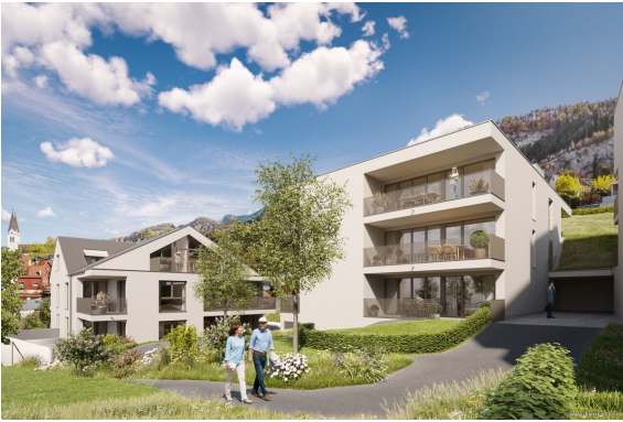
Ansicht | Haus 1+2