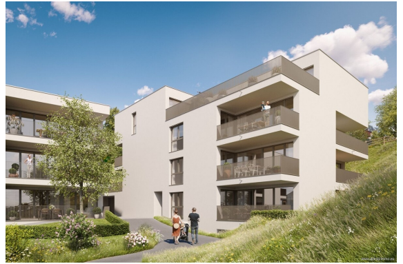
Ansicht | Haus 2+3