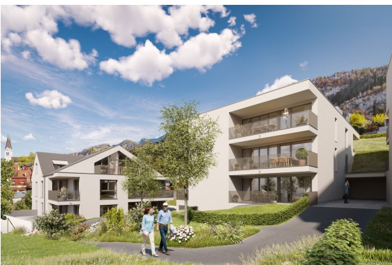
Ansicht | Haus 1+2