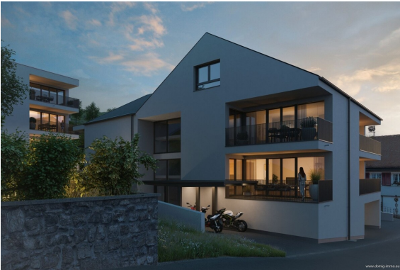
Ansicht | Haus 1+2