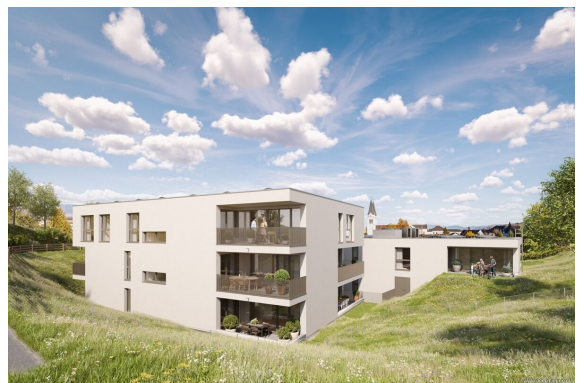
Rückansicht | Haus 2+3