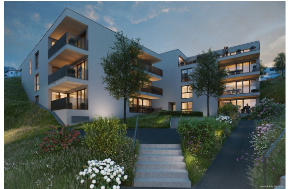
Ansicht | Haus 2+3