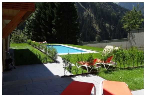
Pool im Best. Haus