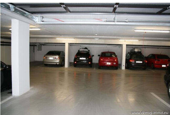
TG - Platz