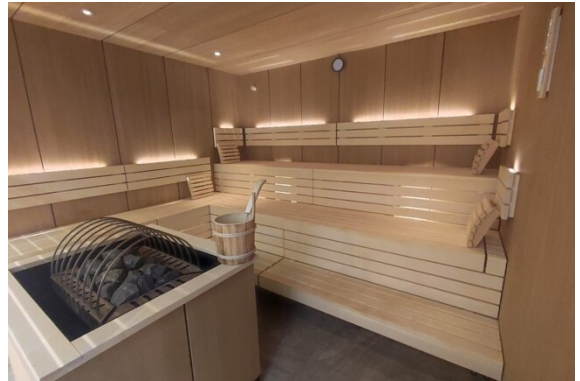
Sauna im EG