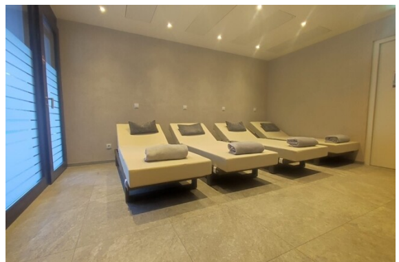
Sauna - Liege