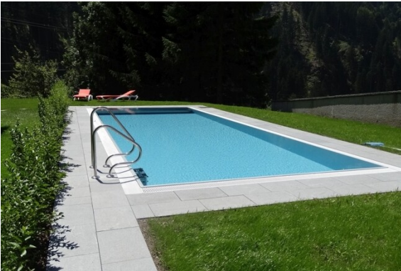
Pool für Hausgäste