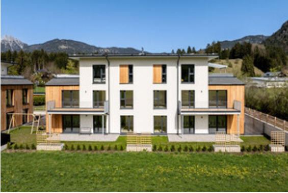
Außenansicht Haus B