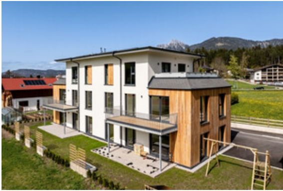
Außenansicht Haus A