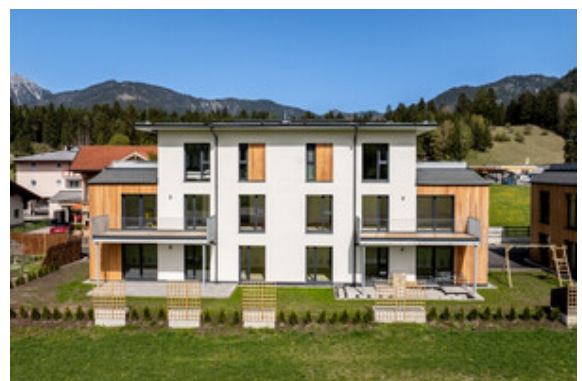
Außenansicht Haus A