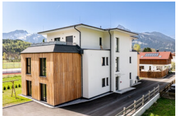
Außenansicht Haus A