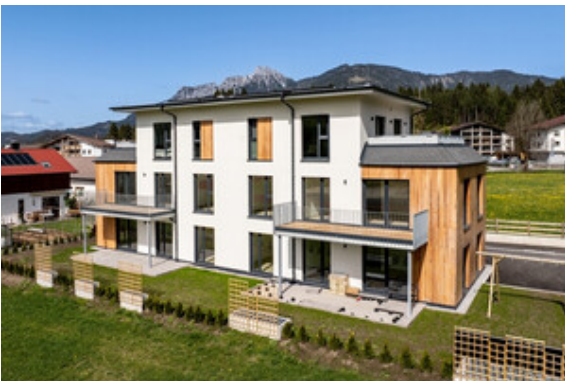
Außenansicht Haus A