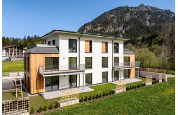
Außenansicht Haus B