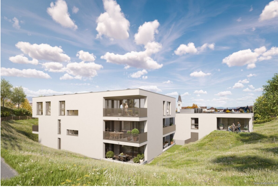
Rückansicht | Haus 2+3