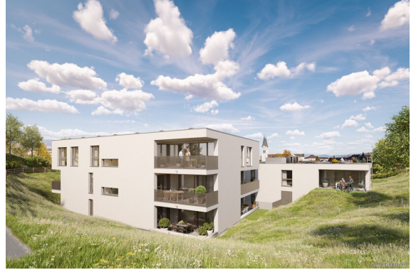
Rückansicht | Haus 2+3