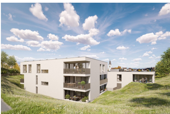
Rückansicht | Haus 2+3