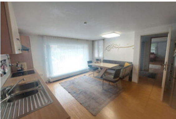
Essen / Kochen Top 1