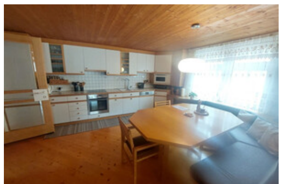
Kochen / Essen Top 2