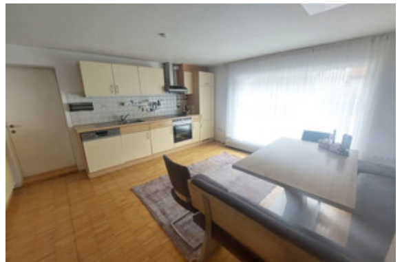
Kochen Top 1