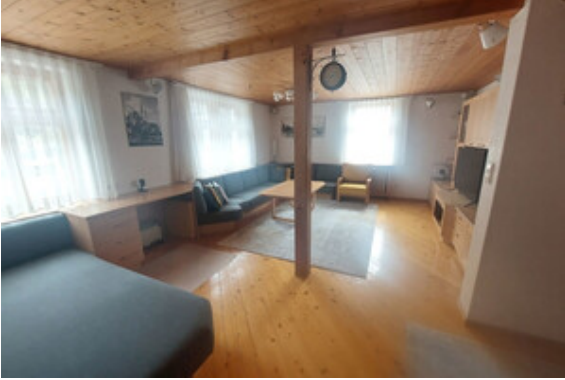
Wohnen Top 2