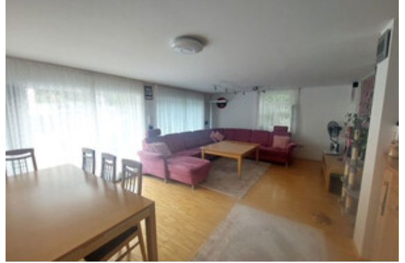
Wohnen Top 1