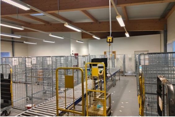
Halle | Lager