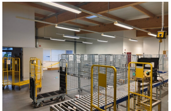
Halle | Lager