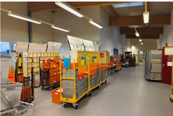
Halle | Lager