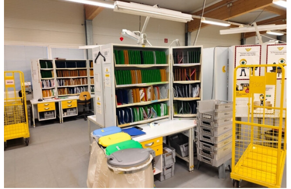
Halle | Lager