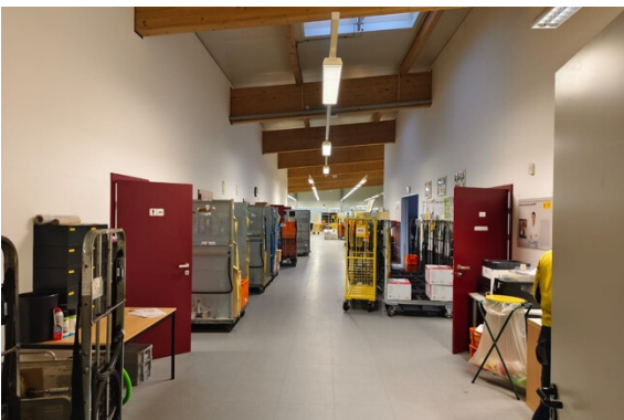
Halle | Lager