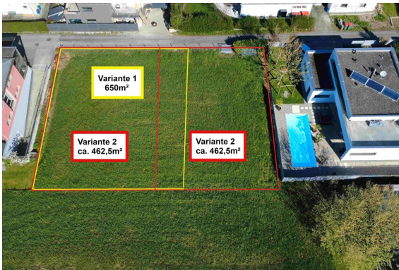
Ansicht | Variante 1 & 2