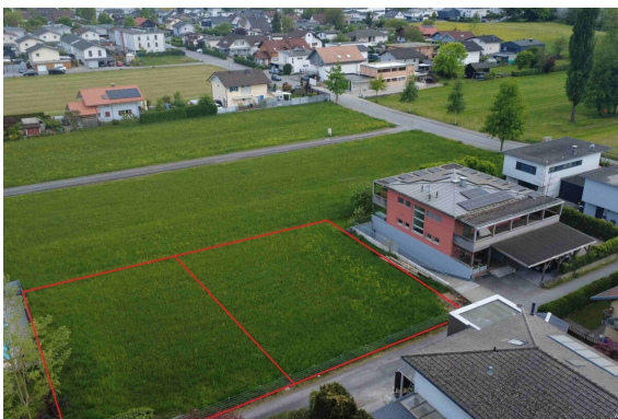
Ansicht | Variante 2