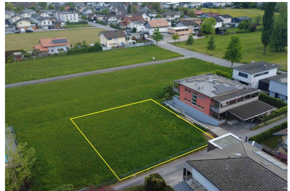
Ansicht | Variante 1