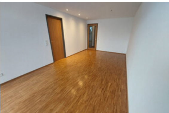
Wohnen / Essen