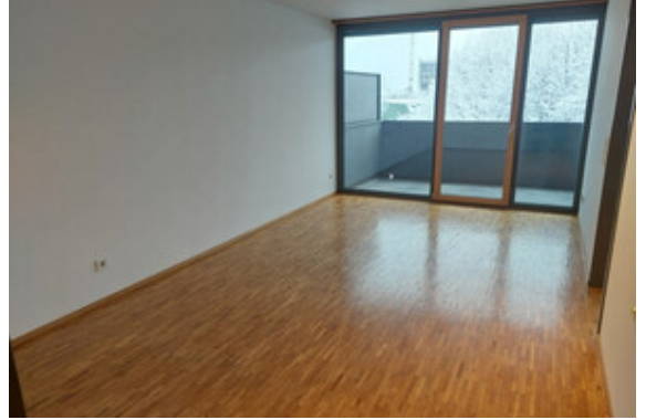
Wohnen / Essen