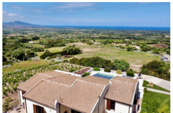
Aussicht / Meerblick