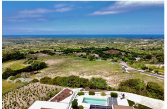
Aussicht / Meerblick