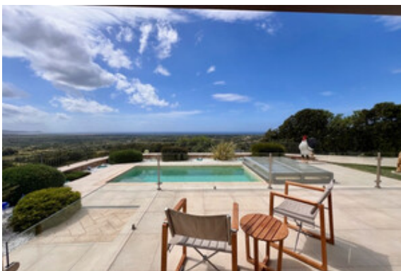
Terrasse / Pool