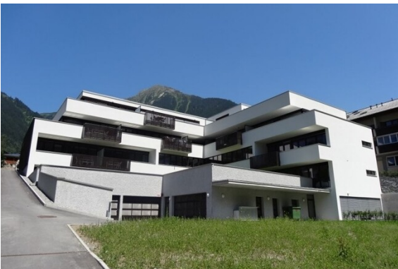
Südwest - SO