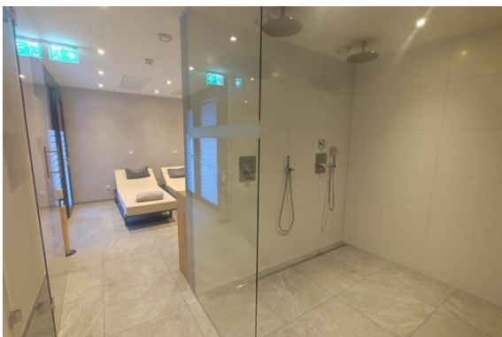
Sauna - DU