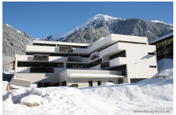
Südwest - WI