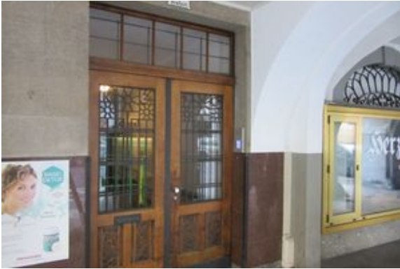
Eingang bei Torbögen