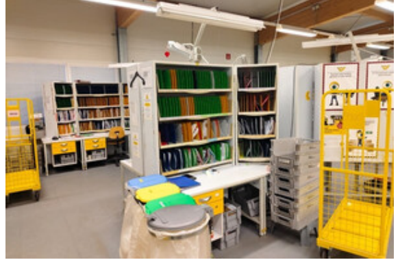
Halle | Lager