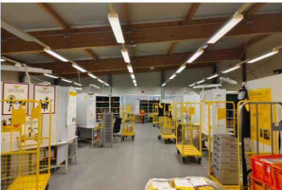
Halle | Lager