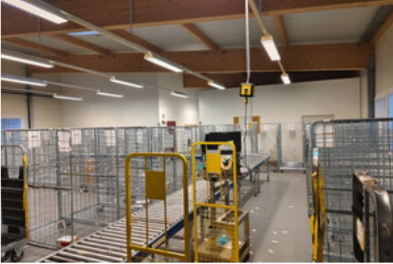
Halle | Lager