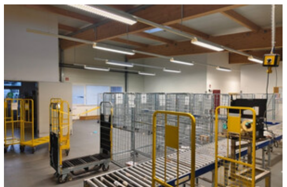
Halle | Lager