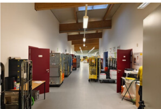
Halle | Lager