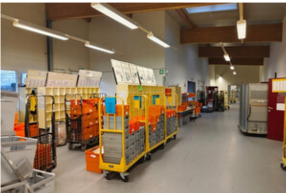
Halle | Lager