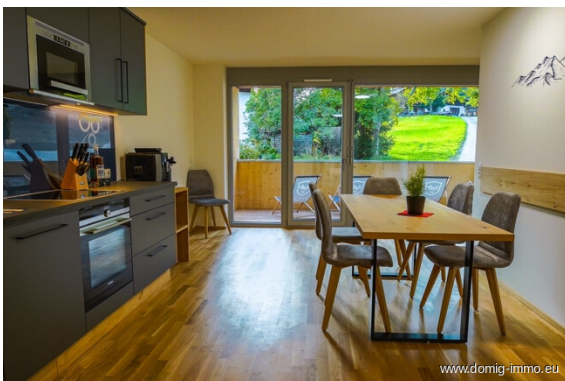
Wohnen / Kochen / Essen