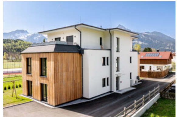
Außenansicht Haus A