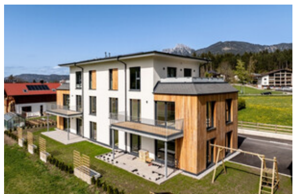
Außenansicht Haus A