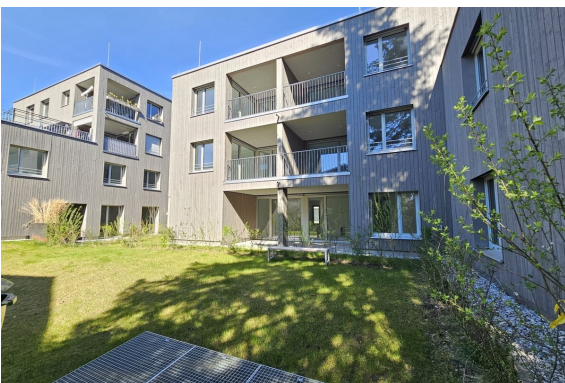
Außenansicht | Gemeinschaftsgarten