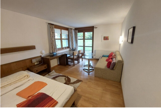
Wohnen / Schlafen