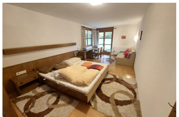
Wohnen / Schlafen