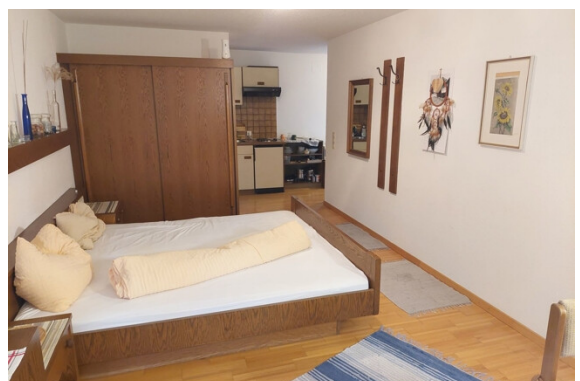
Schlafen / Kochen