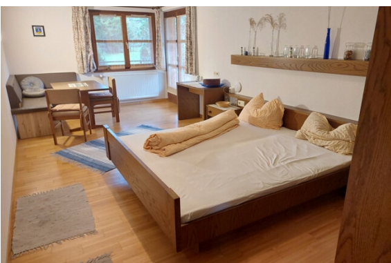
Schlafen / Wohnen