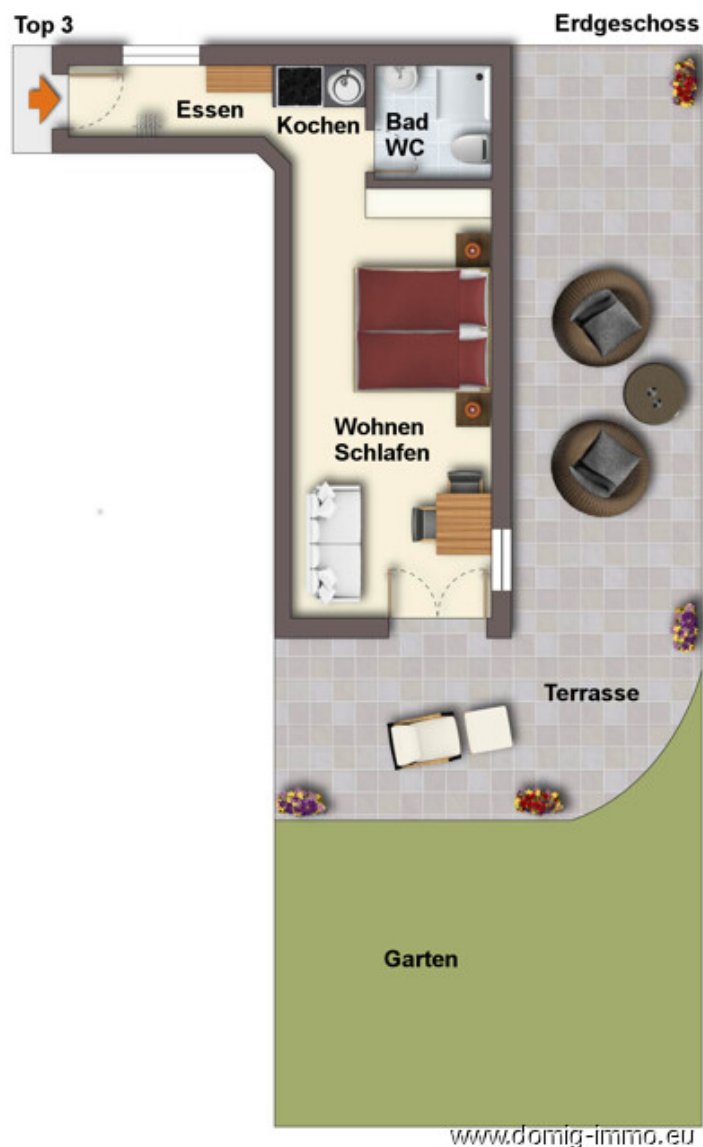
Grundriss ohne Maßstab!