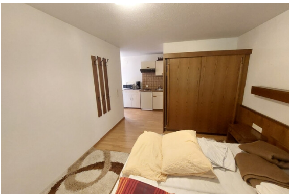
Schlafen / Kochen