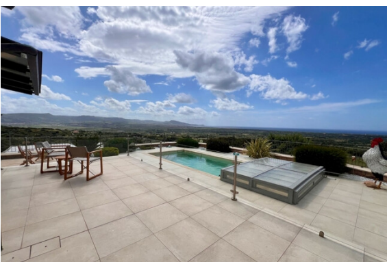
Terrasse / Pool