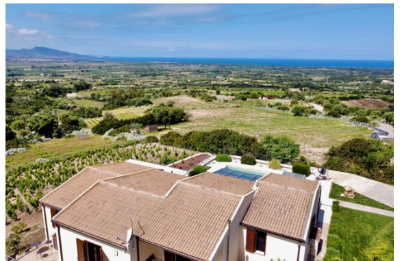
Aussicht / Meerblick