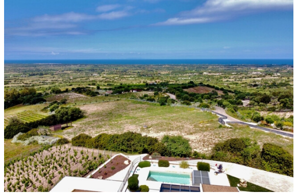
Aussicht / Meerblick