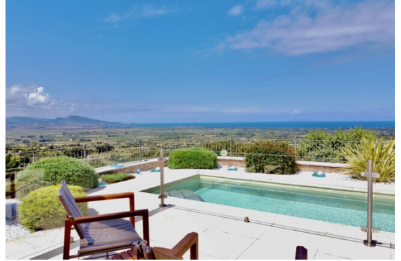
Pool mit Meerblick