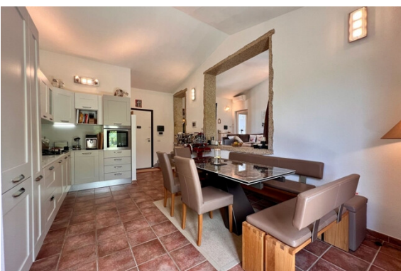
Kochen / Essen