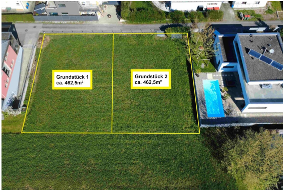
Ansicht | Grundstückteilung