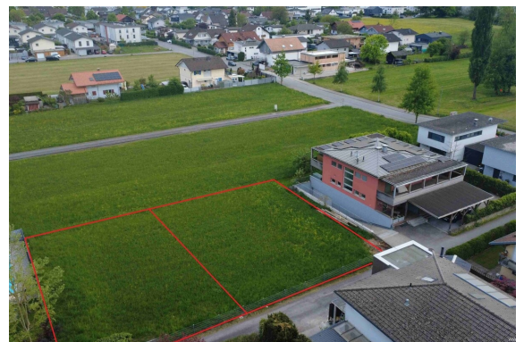
Ansicht | Grundstückteilung